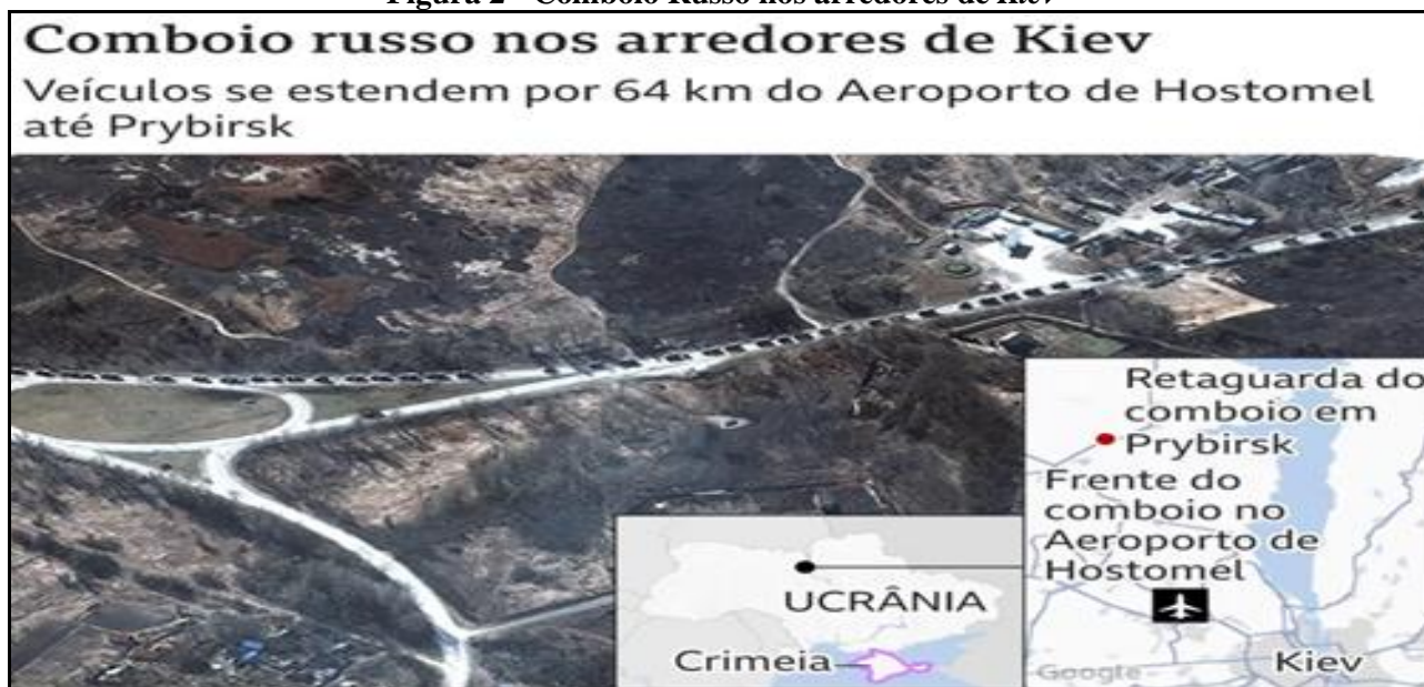
Figura 2 - Comboio Russo nos arredores de Kiev

A terceira lição aprendida é sobre a importância da sincronização do planejamento logístico com as operações militares. Logo após o início da ofensiva russa, foi observado um comboio russo com mais de 60 quilômetros de extensão próximo a Kiev . Tal comboio foi alvo diuturno de ataques aéreos ucranianos dentro de suas ações de A2/AD, gerando sérios problemas para as tropas russas em primeiro escalão, que ficaram estacionadas por falta de combustíveis e munição (JARDIM, 2023b). Assim, deixar de integrar os aspectos logísticos durante a fase de planejamento da missão com a manobra, acarretou numa execução desconexa com as reais necessidades, particularmente com relação aos menores escalões.