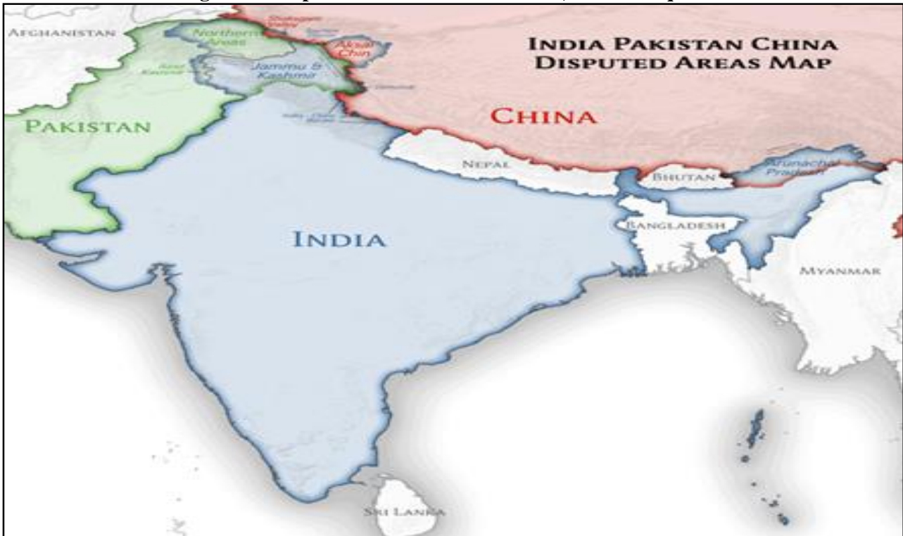
Figura 2 - Disputas territoriais entre China, Índia e Paquistão

entre os três países, nota-se que os conflitos regionais ainda persistem, realidade que vem fazendo com que a região seja palco de uma das maiores disputas territoriais do mundo, envolvendo três importantes atores estatais detentores de armas nucleares, que são possuidores de uma representativa economia no globo e que envolvem uma população total de quase 3 bilhões de habitantes (ARMSTRONG, 2022).