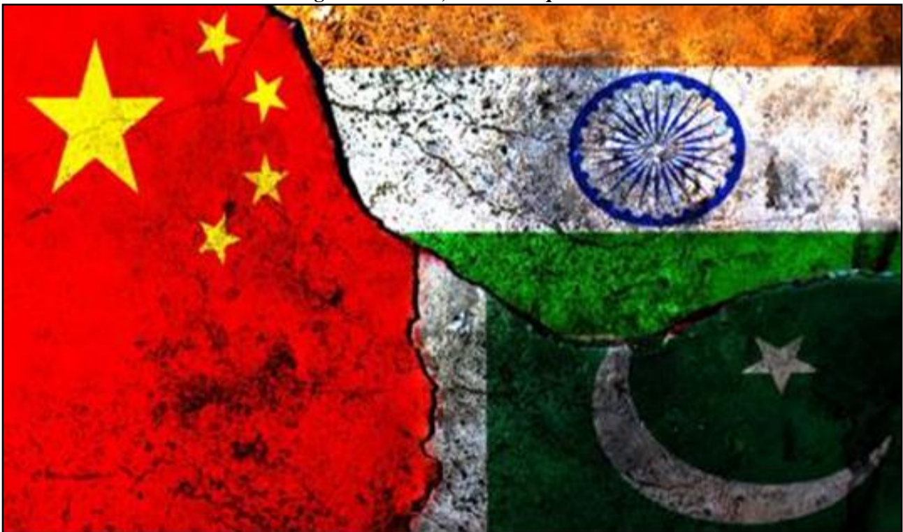
Figura 1 - China, Índia e Paquistão

Tomando como base essas características, este artigo se propõe a analisar, a luz da geopolítica, uma região do continente asiático que envolve três importantes países do cenário mundial: China, Índia e Paquistão.