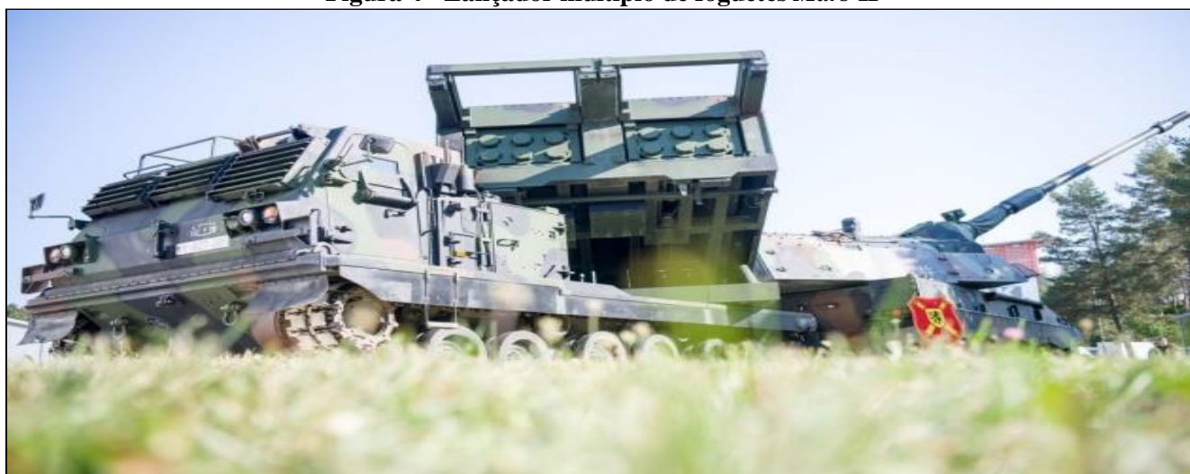
Figura 4 - Lançador múltiplo de foguetes Mars II