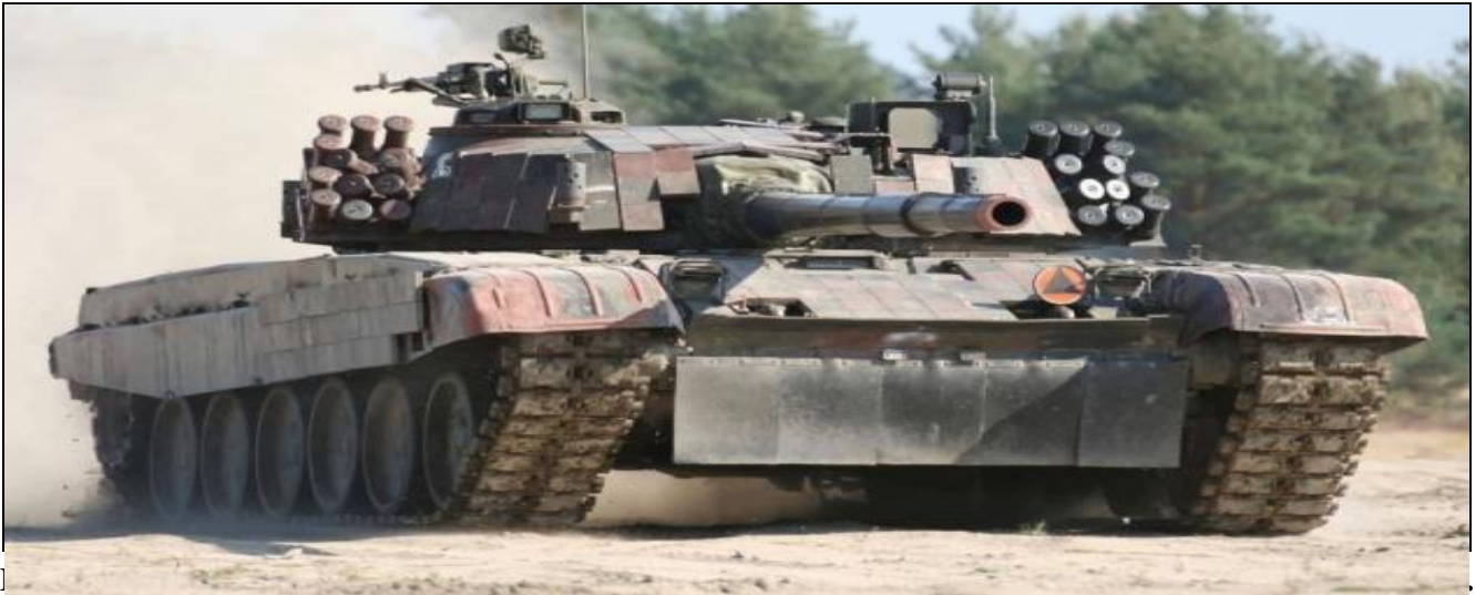
Figura 2 - Carro de Combate PT-91 Twardy

entregado anteriormente para a Ucrânia 240 carros de combate T-72 modernizados e mais de 100 veículos blindados. 6