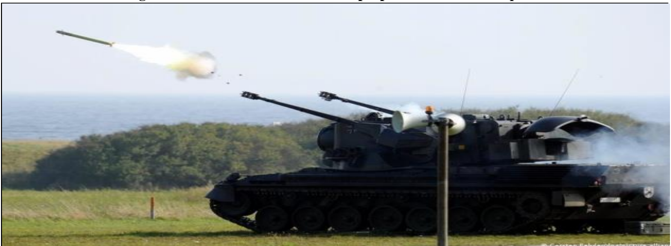
Figura 3 - Unidade de artilharia autopropulsada antiaérea Gepard