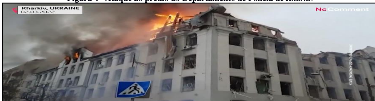
Figura 4 - Ataque ao prédio do Departamento de Polícia de Kharkiv

c. A Rússia concentra mais ataques com o objetivo de conquistar centros urbanos, como Kiev e Kharkiv . Os ataques não atingem somente alvos militares, mas também infraestrutura e áreas civis. Segundo autoridades, um míssil de cruzeiro atingiu a estação de trem de Kiev . Assim, verifica-se o objetivo de controlar as principais cidades e, conseqüentemente, avulta de importância o emprego da artilharia antiaérea na defesa de áreas urbanas.