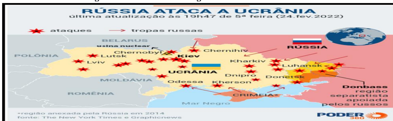
Figura 9 - Estruturas estratégicas atacadas no início da invasão

6) Assim, verifica-se a relevância do estudo estratégico com conhecimento das características da área do Teatro de Operações, o que vem facilitando as ações russas até o momento.