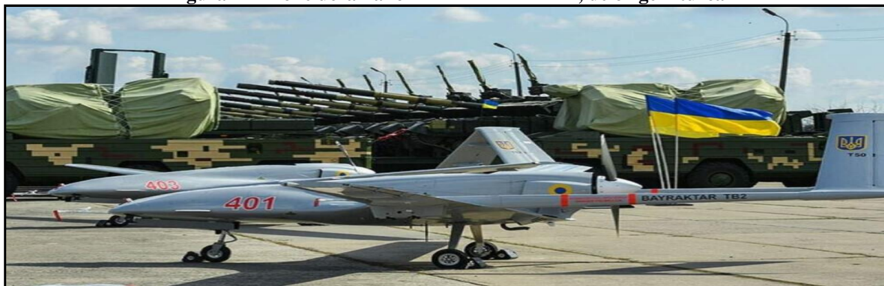
Figura 2 - Drone ucraniano BAYRAKTAR TB2, de origem turca

a. Novos drones de combate Bayraktar TB2 (Figura 2) chegaram à Ucrânia, de acordo com o Ministério da Defesa ucraniano, e já estão sendo distribuídos. Esses drones somam-se a outros 12 que ainda estão sendo utilizados. Estima-se que foram vendidos à Ucrânia por não mais que 10 milhões dólares e estão sendo responsáveis pela destruição de equipamentos muito mais caros, como os sistemas de defesa antiaérea russos, de até 50 milhões. Além disso, têm sido capazes de penetrar as defesas antiaéreas russas em diversas oportunidades. Isso comprova a eficácia e a importância desse novo vetor de ataque no combate moderno. Além disso, apontam para o fortalecimento da defesa antiaérea ucraniana.