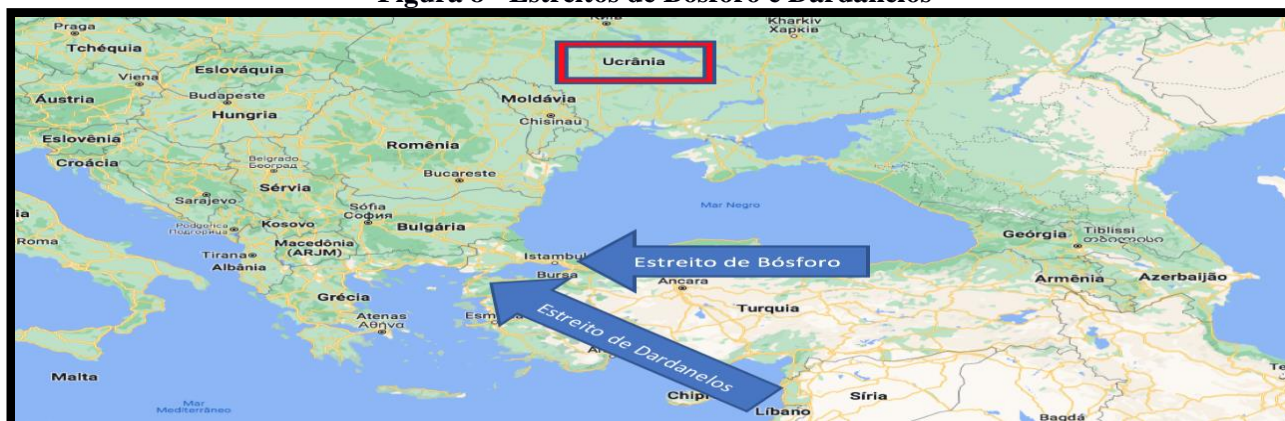
Figura 8 - Estreitos de Bósforo e Dardanelos