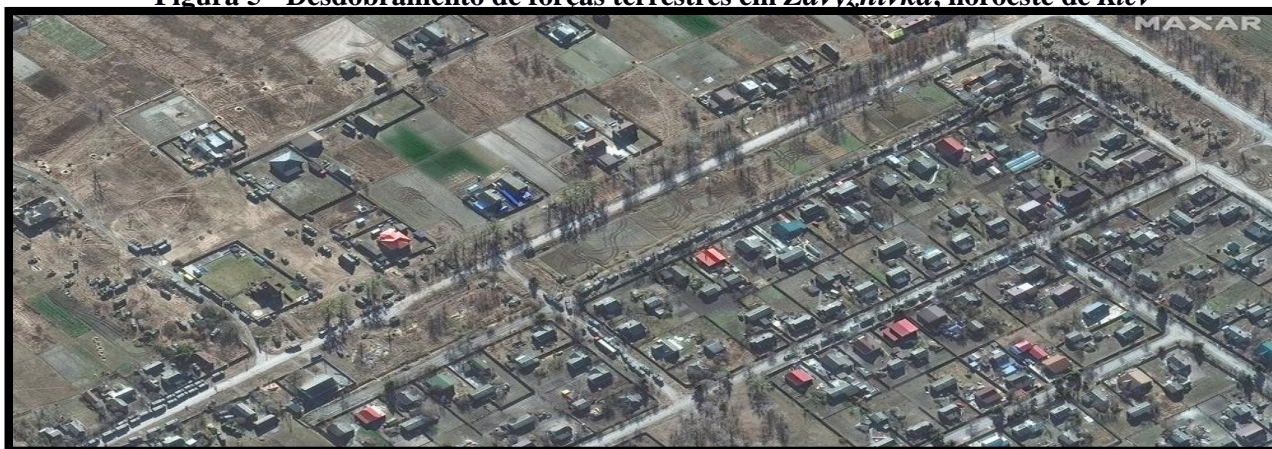
Figura 5 - Desdobramento de forças terrestres em Zdvyzhivka , noroeste de Kiev

2) As imagens mostram uma concentração significativa de forças russas em Zdvyzhivka , uma vila na estrada entre o aeródromo de Antonov e o anel viário que leva ao sul. Essa localidade está distante, aproximadamente, 50 km do centro de Kiev , com acesso por estradas e ferrovias que atendem bem as demandas logísticas das tropas apoiadas. Assim, depreende-se que tal localidade é uma Zona de Reunião Russa, onde, possivelmente, estão localizadas algumas de suas principais instalações logísticas para apoio às tropas em primeiro escalão. Além disso, esse grande desdobramento logístico requer elevados níveis de segurança, ensejando a posição de superioridade aérea ou até uma possível supremacia aérea no conflito.