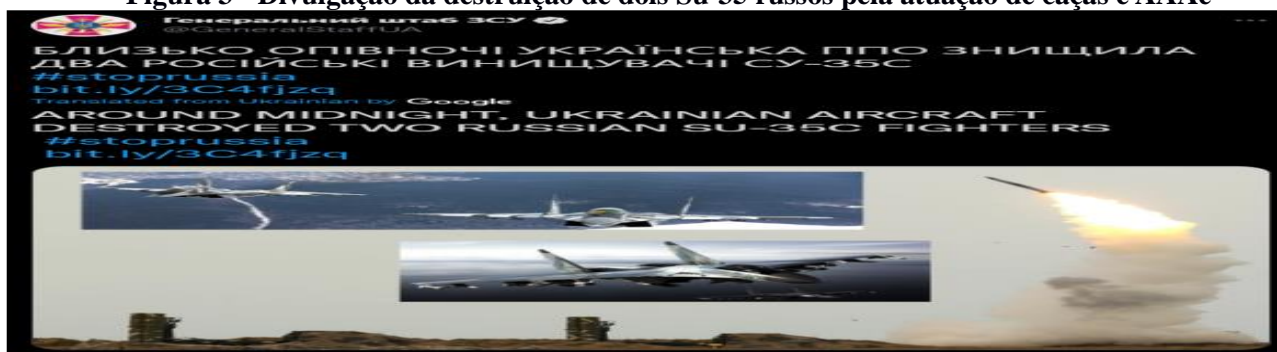
Figura 3 - Divulgação da destruição de dois Su-35 russos pela atuação de caças e AAAe

b. A Força Aérea Ucraniana divulgou hoje a destruição de 2 (duas) aeronaves russas Su-35 (Figura 3). A batalha ocorreu entre 2 (dois) Su-35 russos e 2 (dois) Mig-29 ucranianos, na região de Kiev . Juntamente com os caças ucranianos, houve a atuação do sistema de mísseis antiaéreos S-300, que contribuiu para o resultado da batalha, na qual a Ucrânia perdeu apenas 1 (uma) aeronave. Com isso, verifica-se que a Rússia ainda não possui situação aérea favorável. Além disso, nota-se a importância das Medidas de Coordenação e Controle do Espaço Aéreo, de modo a evitar o fratricídio.