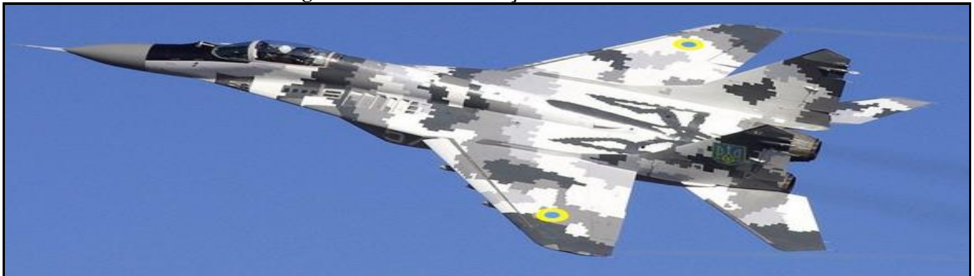
Figura 3 - MIG 29 da Força Aérea Ucraniana