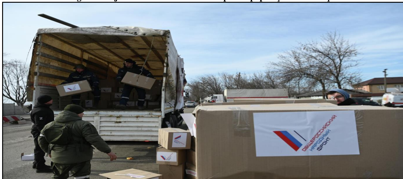
Figura 1 - Ajuda humanitária da Rússia para a população em Mariupol