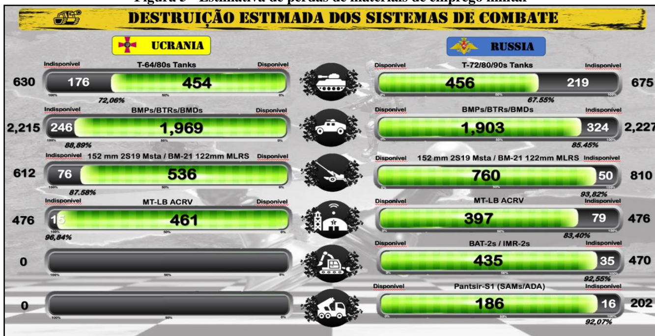
Figura 5 - Estimativa de perdas de materiais de emprego militar